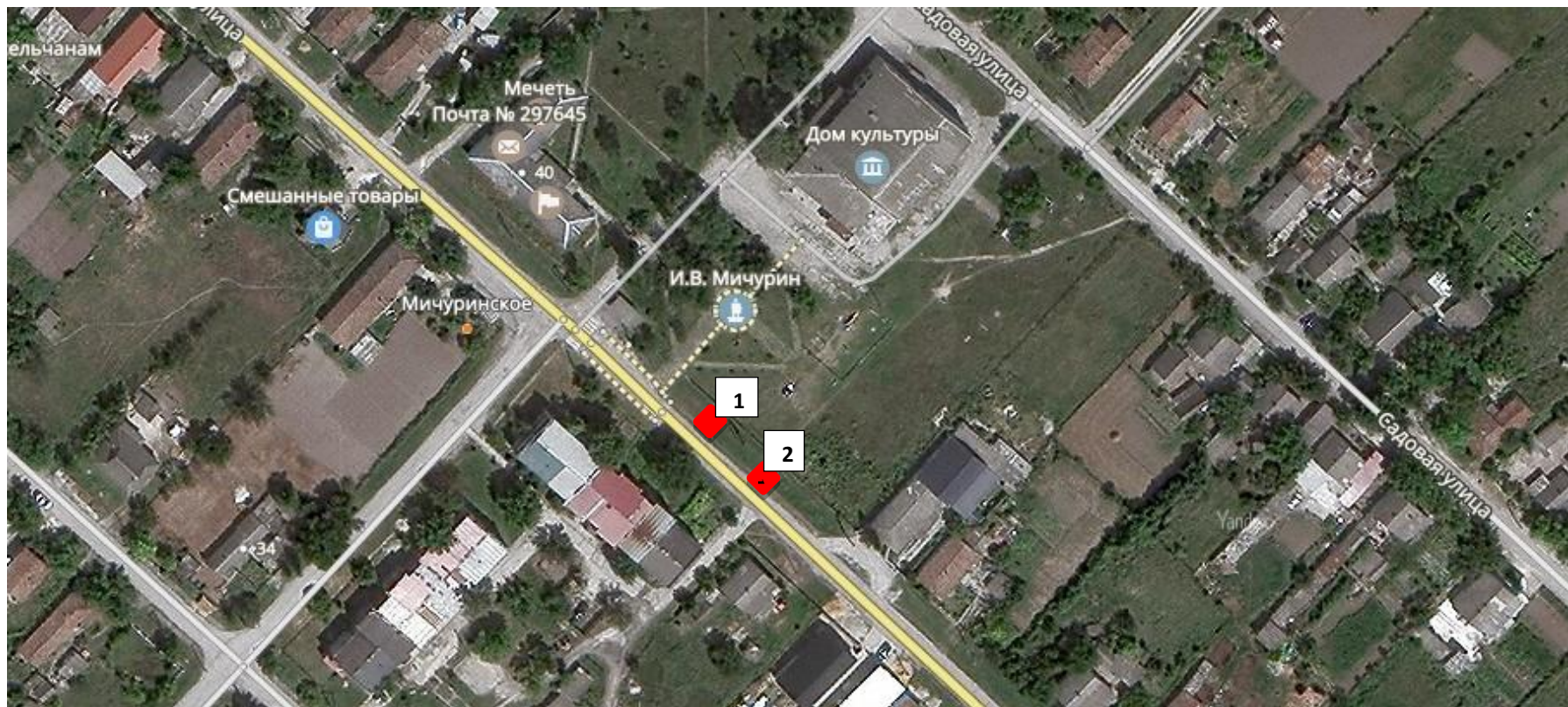
Схема размещения нестационарных торговых объектов на территории муниципального образования Мичуринское сельское поселение Белогорского района Республики Крым (графическая часть 1)

Приложение №2 к постановлению администрации Мичуринского сельского поселения от 08.06.2023 № 68